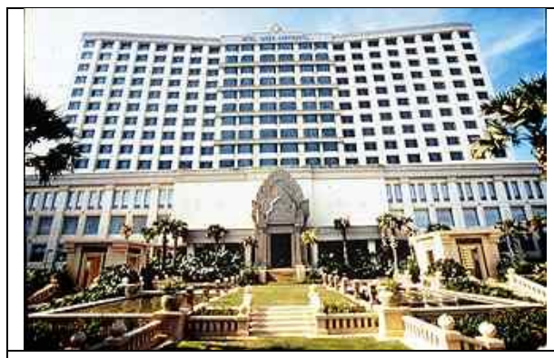
Hotel Inter-Continental *****

សងជាមាសសុទ្ធទំងន់៥តោន មកអោយសម្តេចហ៊ុនសែនវិញ ប៉ុន្តែលោកឧកញ៉ាថេង-ប៊ុនម៉ា ទៅទីក្រុងហុងកុង ទិញមាសសុទ្ធបានតែចំនួន